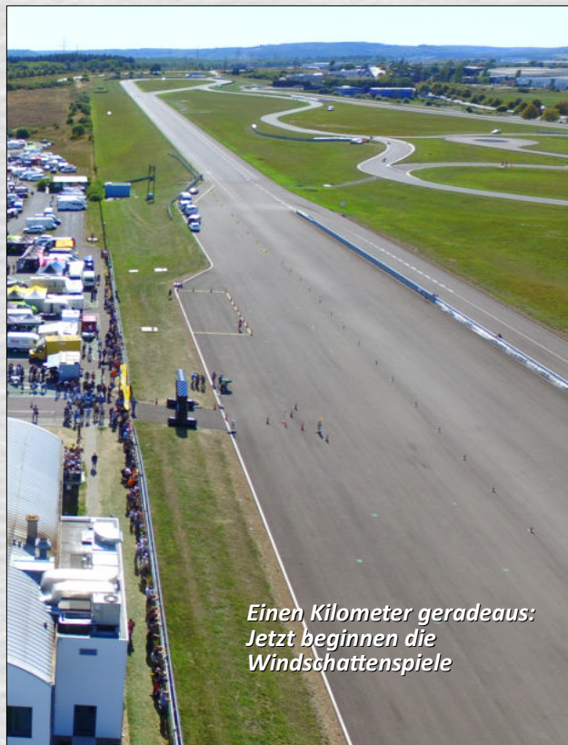
Einen Kilometer geradeaus: Jetzt beginnen die Windschattenspiele

Der Circuit bietet den Fahrern jede Menge Abwechslung, wie kaum eine andere Strecke. Einerseits benötigt man für die 1 Kilometer lange Gerade Leistung, Windschattenspiele sind vorprogrammiert. Andererseits fordert der Streckenteil des Handlinkskurses mit verschiedenartigen Kurven vom Fahrer alles ab. Freut euch auf die Abwechslung.