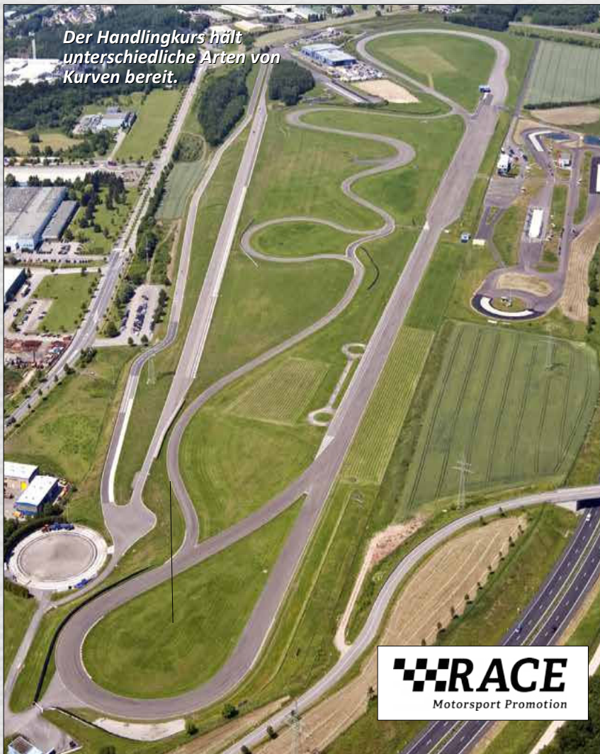
Der Handlinkkurs hält unterschiedliche Arten von Kurven bereit.